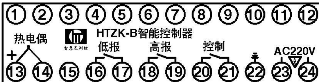
2. 传感器接线示意图